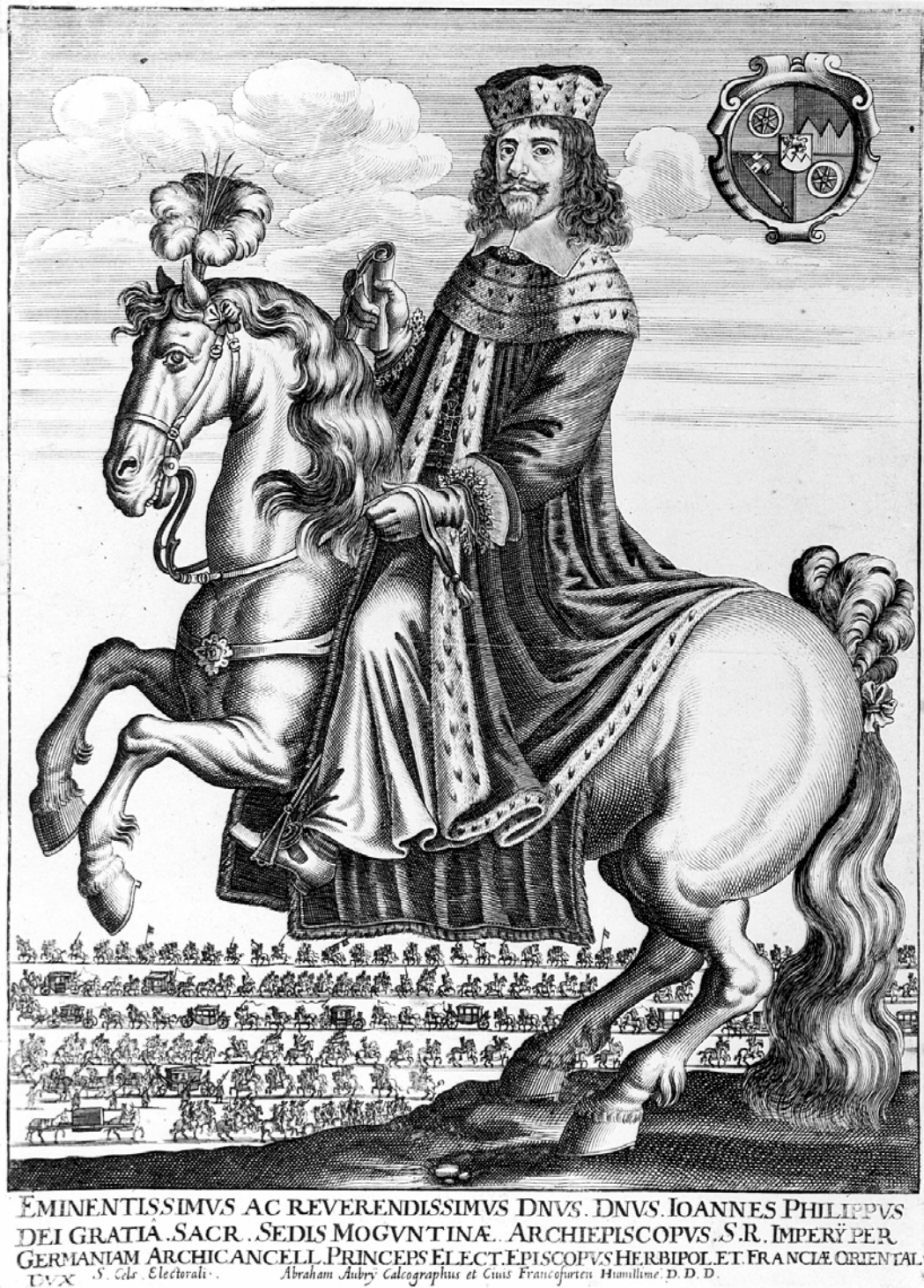
Der Mainzer Kurfürst-Erbischof Johann Philipp von Schönborn