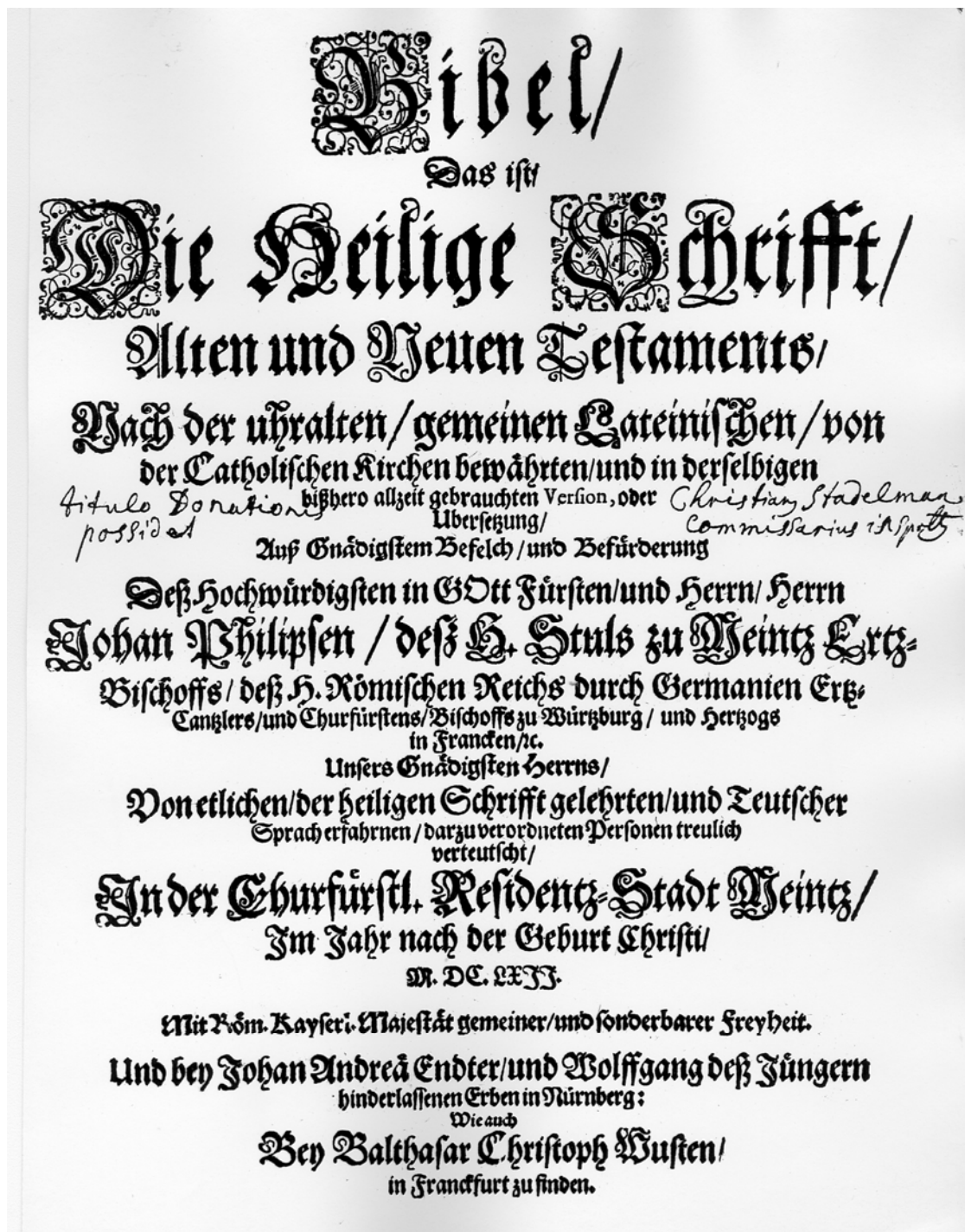
Die deutschsprachige „Mainzer Bibel“ von 1662